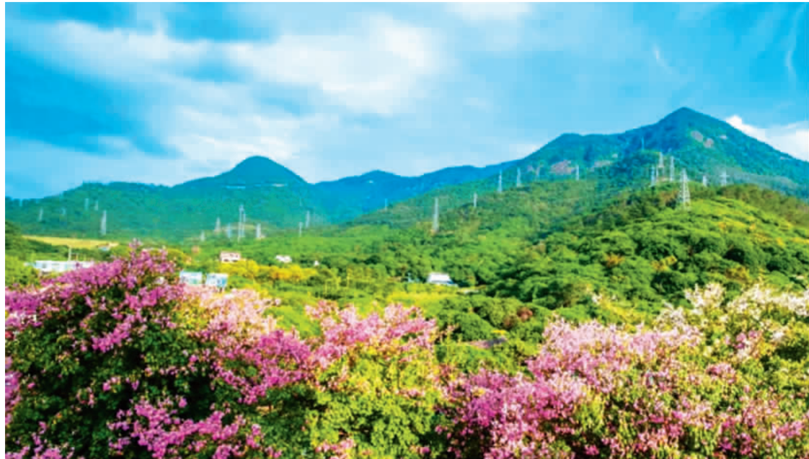
观音山的生态美景。