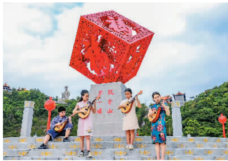
小朋友在观音山福字造型前演奏。