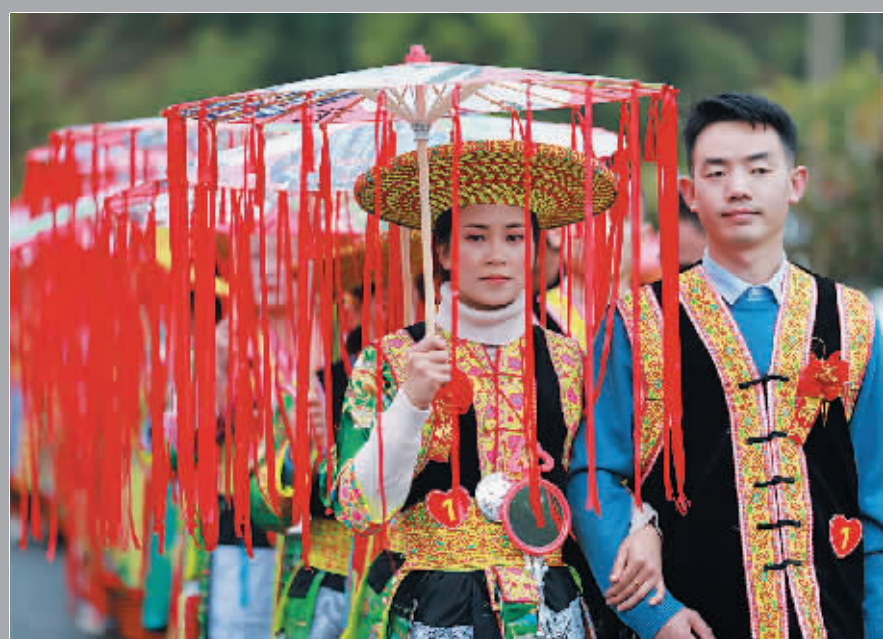
10月26日，湖南省邵阳市隆回县新入扶贫脱贫集体婚礼在隆回县虎行山瑶族乡寨木村举行。“拦门酒”“打酒”“炒茅壳里”“打泥巴”等花瑶婚俗礼仪和习俗，记录了人生的幸福时刻。据悉，花瑶婚俗已被湖南省人民政府公布为第三批省级非物质文化遗产名录项目。