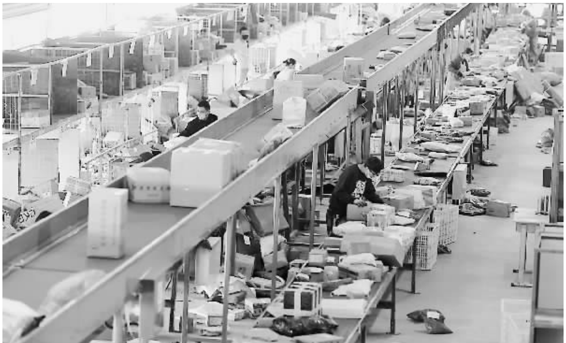
中国物流业景气指数已连续8个月处于扩张区间,10月指数继续回升,显示物流行业运行稳中趋升。图为福建省一物流分拣中心内,工作人员在分拣包裹。