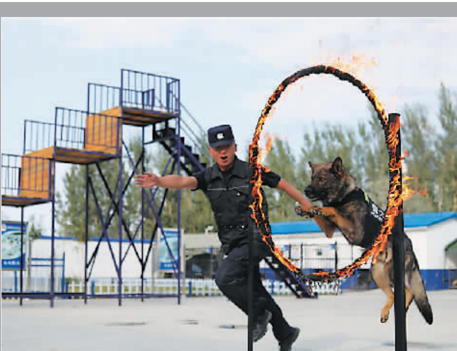
近日，新疆阿勒泰边境管理支队组织开展搜爆犬、缉毒犬、防护犬等犬种实战比武。为确保活动贴近实战环境，支队设置了箱包搜爆、车辆搜毒、制服“暴恐分子”等课目，为侦查破案、维护社会稳定提供了有力支撑。