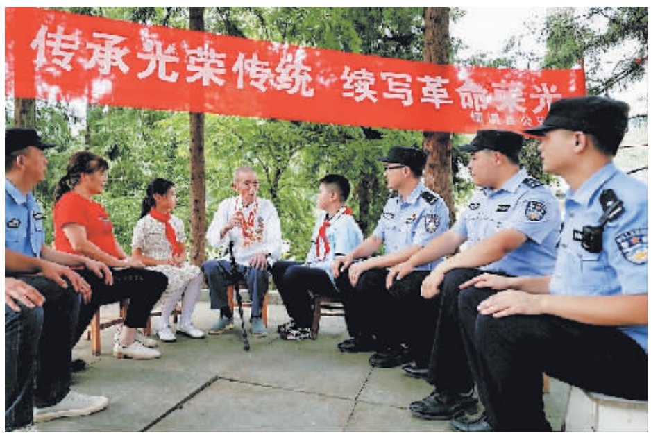
日前,安徽省绩溪县公安局板桥头派出所民警来到辖区新四军老兵家中开展走访慰问活动,并与村民、学生一起聆听老一辈的战斗故事。

我国市场发展不平衡,要素和资源市场发展相对滞后,市场分割问题尚未解决,商品和服务市场仍难以满足消费结构升级的需要。针对这些问题,《关于加快建设全国统一大市场的意见》提出了打造统一的土地、劳动力、资本、技术、数据、能源和生态环境市场的举措。