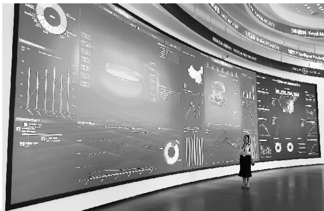
数据是数字经济产业的基石。专家表示,随着东数西算工程的推进,数据流通环节和数据量将会显著增加,将大幅带动数据安全的相关需求。图为重庆市荣昌区的国家级生猪大数据中心。

到2035年,数据安全产业进入繁荣成熟期。产业政策体系进一步健全,数据安全关键技术