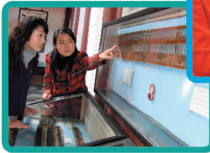
算盘在我国商贸服务业中曾发挥过重要的作用。图为游客在珠算博物馆参观算盘。

但实际上,商贸服务业一步步从自动化走向智能化的过程远不是“从收款机到互联网”这么简单,也并非一路坦途,这其中既有打破旧有体制机制束缚的眼光、勇气和担当,也有锐意探索进取的决心。