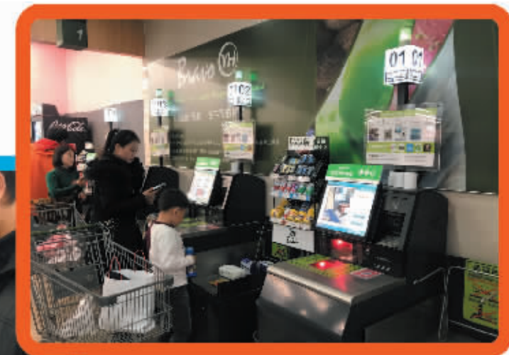
图为消费者在某超市的自助收银机器前进行操作。

“有了核心专利后,我们的产品越来越受到认可,销售量每年增长30%。为了保护知识产权,我们围绕核心专利进行了20余项相关专利布局,形成了防御风险的盾