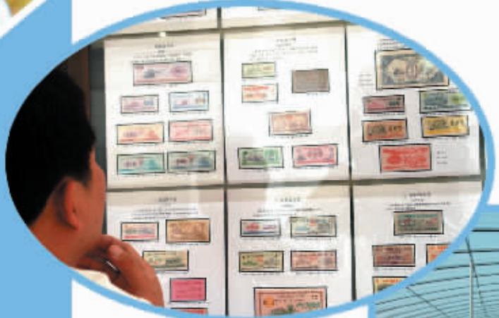
在中国粮油精品展示交易会上,一位参观者在认真观看展出的粮票。