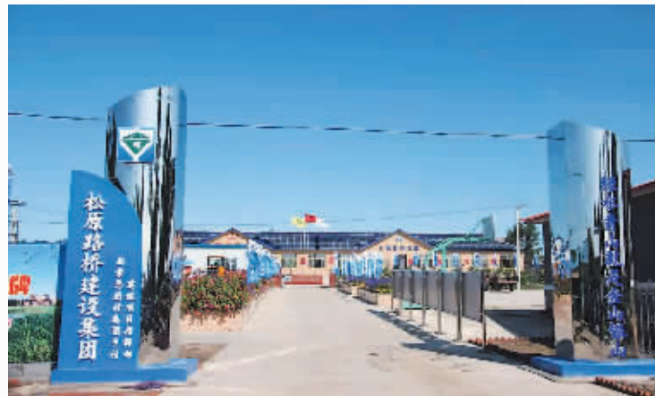
陕西松原路桥建设集团

等。新的征程赋予新的使命,路桥人积极响应党中央号召,投身到美丽乡村建设中。今年,在美丽的查干湖畔新建了三处垃圾中转站、一处污水处理站,有效改善了当地的环境,获得了群众的赞誉。投资3000万元在查干湖西索恩图村兴建了文化广场、乡村公路,参与街面美化亮化工程建设,使村民的居住和生活水平得到改善和提高,促进了当地旅游业的发展,为美丽乡村建设添砖加瓦。与此同时,在查干湖景区建设了三处生态停车场,很多项指标有望成为生态停车场的行业指导标准,为我国建设高质量、高标准生态停车场提供基础技术参照。在基础设施建设方面,公司承建了前郭县蒙古族非遗(郭尔罗斯