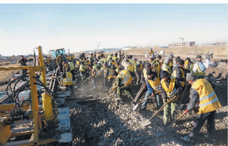
2012年滨州线技术改造工程现场

态小镇建设中,将在建设规划中处理好生态与旅游、当前与未来、设计与实施、投资与回报、小镇与交通之间的关系,切实保护环境,切实维护民生稳定,为建设美丽乡村贡献自己应有的力量。