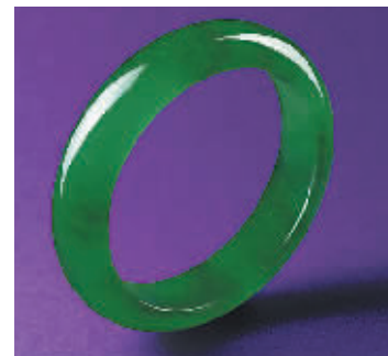
珍罕天然翡翠手镯 估价:300万至450万港元 成交价:360万港元

天成国际董事总经理汪洁及珠宝部主管黄启梵表示:“在新冠肺炎疫情及整体市场保守的情况下,我们很欣慰见到团队悉心挑选的珍品广受藏家喜爱,买气不减。很多未能亲临现场的藏家,改以电话或书面委托的方式积极参与拍卖,竞拍气氛热烈。天成国际衷心感谢各地藏家的鼎力支持,并承诺将再接再厉,继续努力为大家呈上更多琳琅满目的珠宝盛宴。”