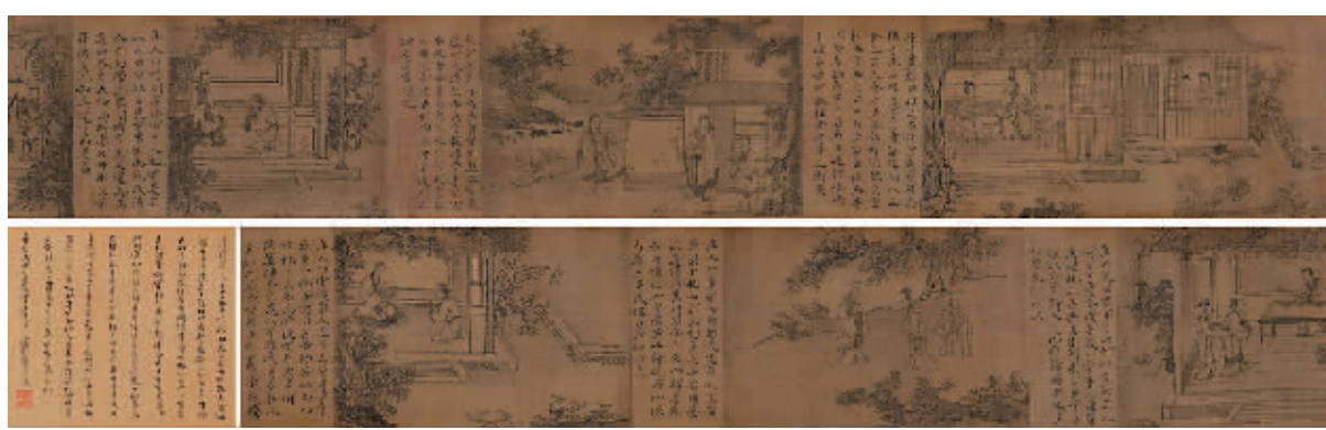
TOP1 虞集(款)《授道图卷》 估价:5万至8万元 成交价:327.75万元

激烈竞价的角逐,我们收获了比较满意的业绩。”确实,此次拍卖佳绩可谓来之不易。一场突如其来的疫情扰乱了拍卖计划,嘉德四季第56期拍卖会从原定的3月举行,日期一改再改,最后定格于7月。所以,在不少业内人士看来,这场拍卖会是在释放行业重启信号之余,更以喜人佳绩提振了市场信心。尤其是网络买家的巨大力量在这次拍卖中得以充分展现,也彰显了一家老牌拍卖行的市场号召力,以及不断创新所取得的成绩。