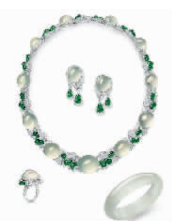
天然冰种翡翠首饰套组 估价:280万至380万港元 成交价:276万港元