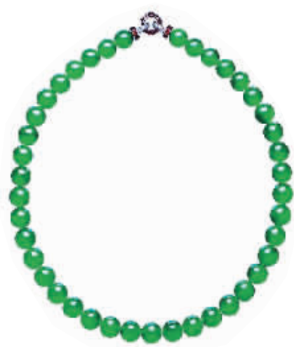
缅甸天然翡翠珠配红宝石及钻石项链 估价待询 成交价:2360万港元