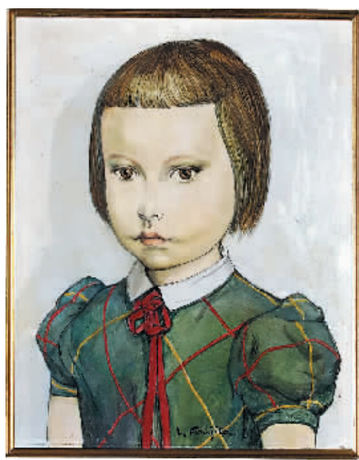
藤田嗣治《系红色蝴蝶结的小女孩》 估价:160万至240万港元 成交价:188.8万港元

此番现当代艺术专场在设计上做了相应调整,通过聚焦一系列跨越东西方的当代艺术家作品,为藏家发掘新一轮极具潜力的收藏