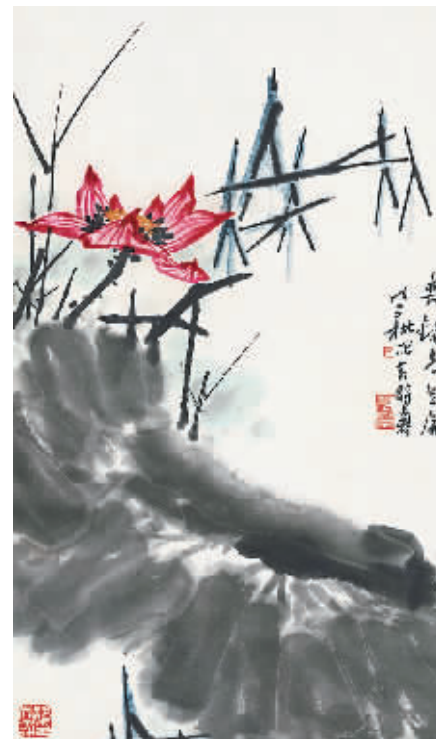
TOP3 潘天寿《红荷图》 估价:180万至280万元 成交价:218.5万元