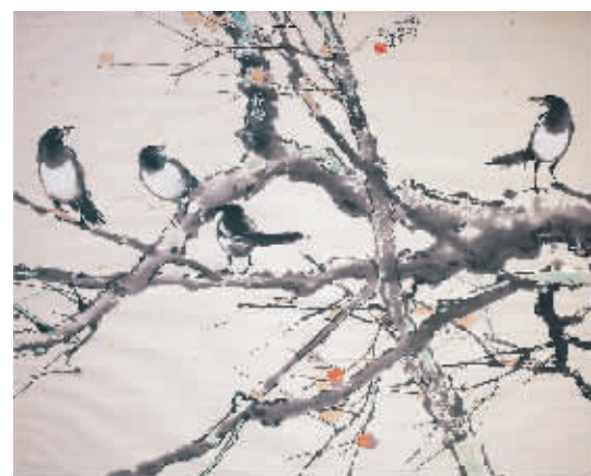
徐悲鸿《秋兴图》 估价:220万至280万港元 成交价:845.5625万港元

拍卖结束后,保利香港拍卖执行董事张益修表示:“本次7月拍卖我们在征件策略及专场设计上做出相应调整,来自世界各地的藏家从在线预览、拍卖直播以及多渠道竞拍方式角逐心仪拍品,见证了市场对于收藏的强劲信心有增无减,最终各大板块交出令人满意的成绩单,同时也更加期待为众藏家呈献更为丰富的秋拍臻宴。”