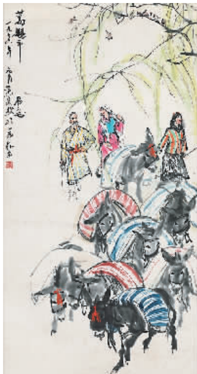
TOP2 黄胄《运粮图》 估价:280万至380万元 成交价:322万元