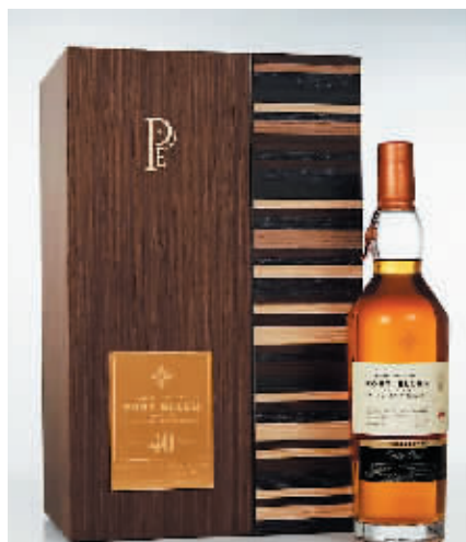
艾伦港70年单一麦芽雪莉桶 1978年入桶 2018年装瓶 全球限量338瓶 估价:6万至10万港元 成交价:56.64万港元