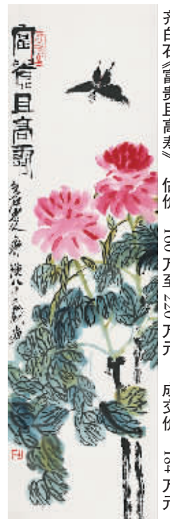
TOP4 齐白石《富贵且高寿》 估价:160万至220万元 成交价:214万元