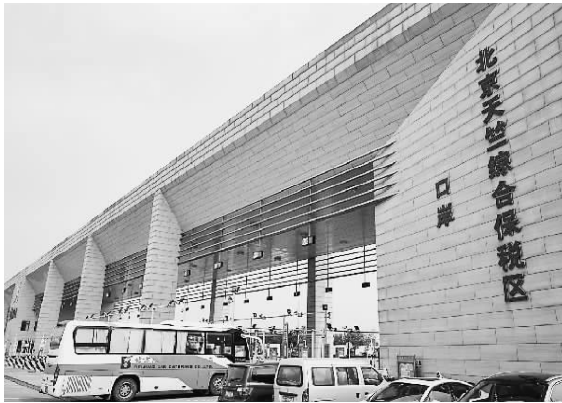
五年来,北京已经开展了三轮服务业扩大开放综合试点,打造国家服务业扩大开放综合示范区。图为北京自贸试验区中的国际商务服务片区——北京天竺综合保税区口岸入口。

进贸易投资便利化。如试行跨境服务贸易负面清单管理模式;与“一带一路”沿线国家开展国际贸易“单一窗口”建设合作;下放中资邮轮、国际客轮运输相关业务的许可权限;全面实行不动产登记、交易和缴税线上线下一窗受理,并行办理等。