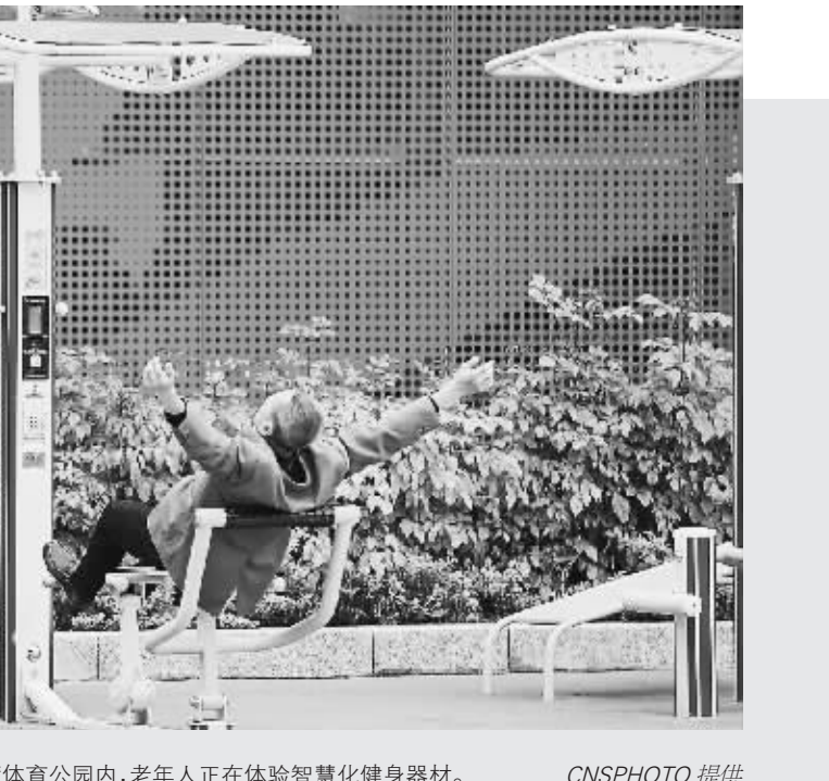
福建省福州市鼓楼区的西河智慧体育公园内,老年人正在体验智能化健身器材。

根据平安银行股份有限公司北京分行与北京易融财富资产管理有限公司签订的债权转让协议,平安银行股份有限公司北京分行已将其对北京易融财富资产管理有限公司的全部债权及相关权益转让给北京易融财富资产管理有限公司。