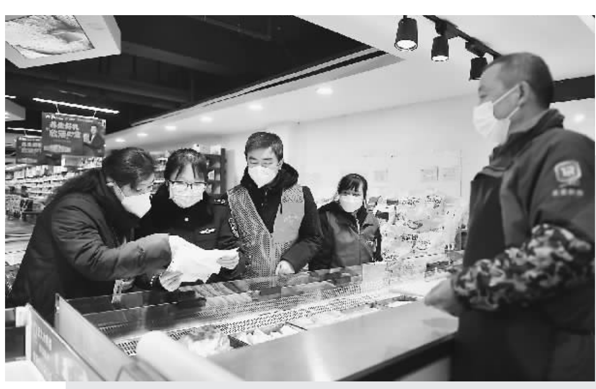
日前,在安徽省合肥市庐阳区大杨镇辖区一超市,市场监督管理部门工作人员对超市内在售的肉制品、奶制品、米面粮油、调味品等进行食品安全检查,确保群众“舌尖上的安全”。图为工作人员正在查看肉制品相关溯源信息。

建议。省级卫生健康行政部门与同级农业农村、市场监管、进出口食品监管等部门以及行业组织、技术机构建立常态化沟通协调机制,并将人大建议、政协提案、信访咨询、网络舆情等涉及食品安全标准相关意见建议纳入常态评价范围,及时沟通、共同研究基层监管部门、行业企业等在执行食品安全标准中遇到的问题。各部门对收集到的意见,要及时分析研究,将有效意见、合理建议通过平台在线填报。社会各方也可通过该平台反馈食品安全标准执行中遇到的问题及建议,并提供相关依据。 开展专项评价,侧重对重点食品安全标准开展深度评价,评价范围包括新发布实施的食品安全国家标准以及涵盖范围广、影响